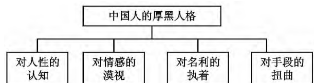
图1 中国人厚黑人格的四维构想

基于上述的发现,研究者尝试建构中国人厚黑人格,包括对人性的认知、对情感的漠视、对名利的执着和对手段的扭曲四个维度,如图1。